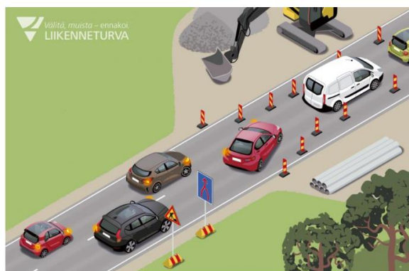
KUVA 5: Liikenneturva. Merkki, jossa on punainen kaksihaarainen nuoli sinisellä pohjalla, kertoo kahden kaistan yhdistymisestä. Sen nähdessään pitää valmistautua siirtymään yhdistyville kaistalle.