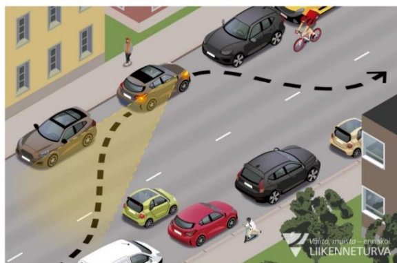
KUVA 4: Liikenneturva. Taajaman kaksisuuntaisella tiellä pysäköinti ja pysäyttäminen mahdollista myös vasemmalle puolelle tietä.