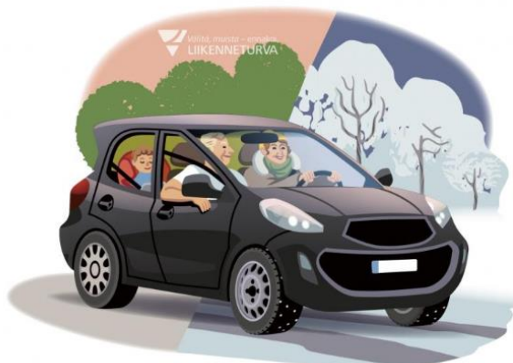
KUVA 6: Liikenneturva. Ota keliolosuhteet huomioon kokonaisuutena, ennako, äläkä anna talven yllättää.